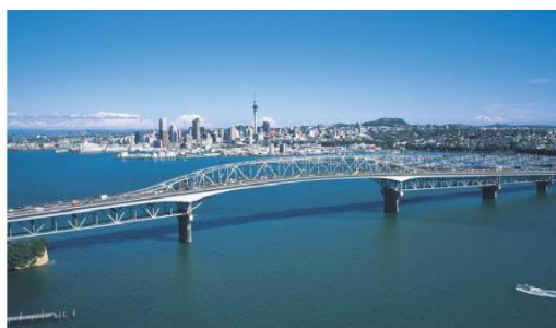
奥克兰市北岸大桥